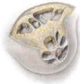
Die Brust mit dem Fettgewebe (gelb) und dem Drüsengewebe (grau)

Die Brustdrüse besteht aus Drüsengewebe, Fett und Bindegewebe. Das Drüsengewebe ist aus Drüsenläppchen (Lobuli) aufgebaut. Sie produzieren die Muttermilch und münden in kleine Kanäle (Ductus). Die Kanäle verbinden sich zu grossen Ausgängen und führen zur Brustwarze.